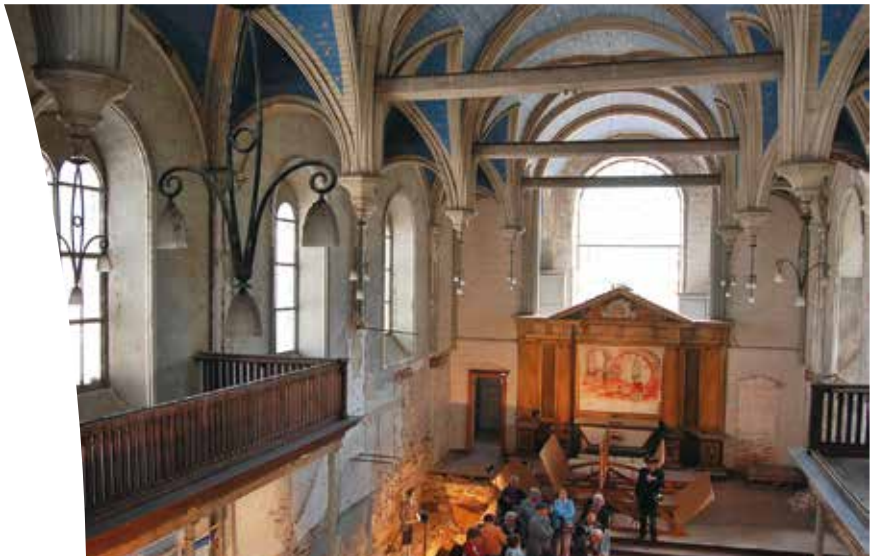
Dans la Forerie-chapelle d'Indret sont inscrits à l'Inventaire le sol et les infrastructures voûtées du moulin à marées (1777) ainsi que la voûte en charpente (1842) avec ses luminaires

En 1996, DCNS (NavalGroup) obtient l'accord d'un permis de démolir la Forerie-chapelle. Indre Histoire d'îles alerte les hautes instances de l'État jusqu'au Ministère de la Culture 4 . Le permis est suspendu. Au vu des résultats des fouilles, la Municipalité d'Indre se porte acquéreur de