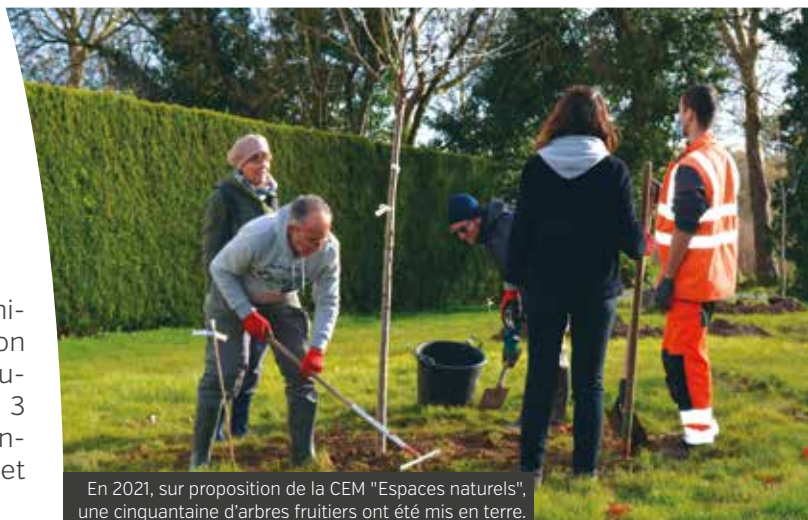
En 2021, sur proposition de la CEM "Espaces naturels", une cinquantaine d'arbres fruitiers ont été mis en terre.