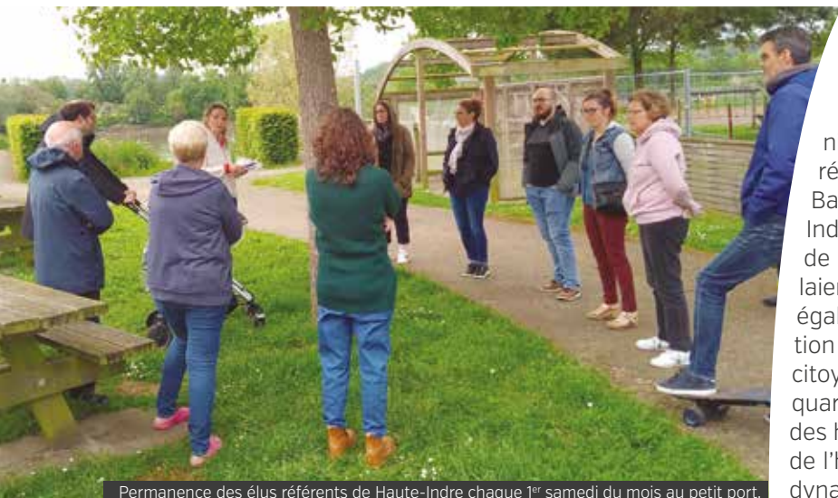
Permanence des élus référents de Haute-Indre chaque 1 er samedi du mois au petit port.