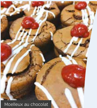
Moelleux au chocolat

Pour Nelly GAUROIS, élue en charge du Projet Alimentaire Territorial, il est indispensable de compléter le travail réalisé sur la qualité des approvisionnements par l'éducation des enfants au goût et de donner du plaisir grâce à des actions d'animation régulières dans les restaurants. >