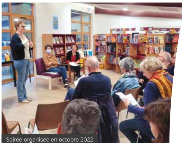
Soirée organisée en octobre 2022

Les castors, habitants de l'île, retrouvent ainsi un espace plus agréable à vivre.