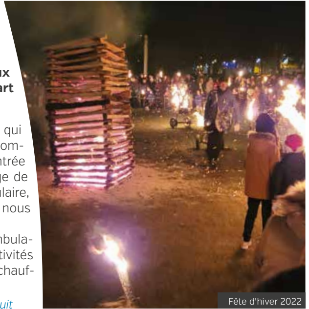
Fête d'hiver 2022

Vendredi 16 décembre à partir de 20h - Place de l'église - Gratuit