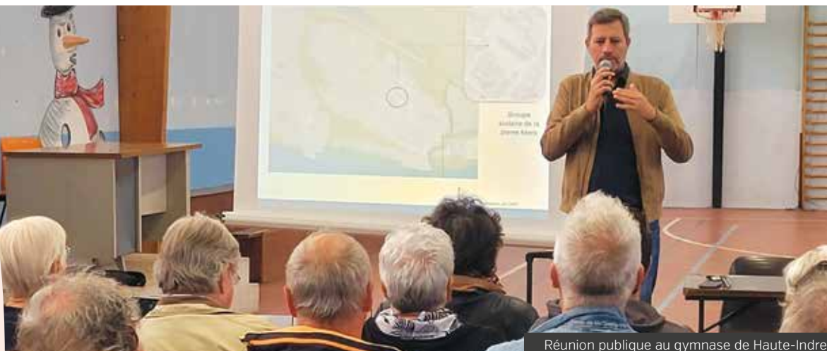
Réunion publique au gymnase de Haute-Indre