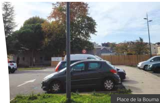
Place de la Bouma

Les aménagements tactiques permettent, depuis le début d'année, de tester des solutions susceptibles d'être reprises dans le cadre des aménagements qui seront réalisés d'ici la fin du mandat. Des réunions et des échanges réguliers ont lieu avec les riverains et les usagers de cet axe majeur de la commune. Sous la houlette des services du Pôle Loire Chézine et en relation étroite avec la SEMITAN, des solutions différentes sont étudiées. Il s'agira de faire cohabiter les différents usages (en tenant compte du Plan de Déplacements Urbains) dans un cadre très contraint, du fait de l'étroitesse de la rue. Les travaux (dont l'enfouissement des réseaux) seront réalisés sur deux mandats compte-tenu de l'importance de leurs montants prévisionnels.