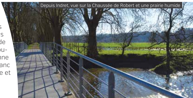
Depuis Indret, vue sur la Chaussée de Robert et une prairie humide

Le parcours démarre sur les coteaux, par un belvédère panoramique aménagé près du château d'Aux. Au fil de votre promenade, vous longerez un étier, franchirez les prairies humides grâce à un pont refait à neuf et un passage en bois sur pilotis. Puis, vous parcourez la chaussée de Robert et ses 140 platanes avant de franchir le nouveau pont de la Rondeau pour atteindre l'ancienne île d'Indret. À votre arrivée, installez-vous sur le banc monumental devant la Loire et observez le fleuve et l'autre rive.