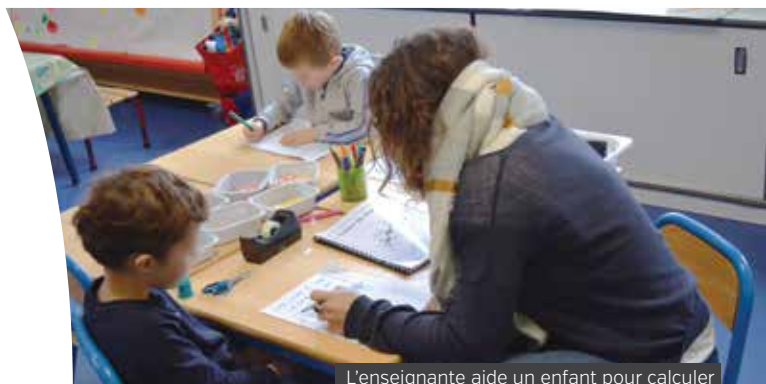
L'enseignante aide un enfant pour calculer

« Non, il faut seulement respecter la laïcité (ne pas afficher une religion). J'accompagne les délégués en particulier au début. »