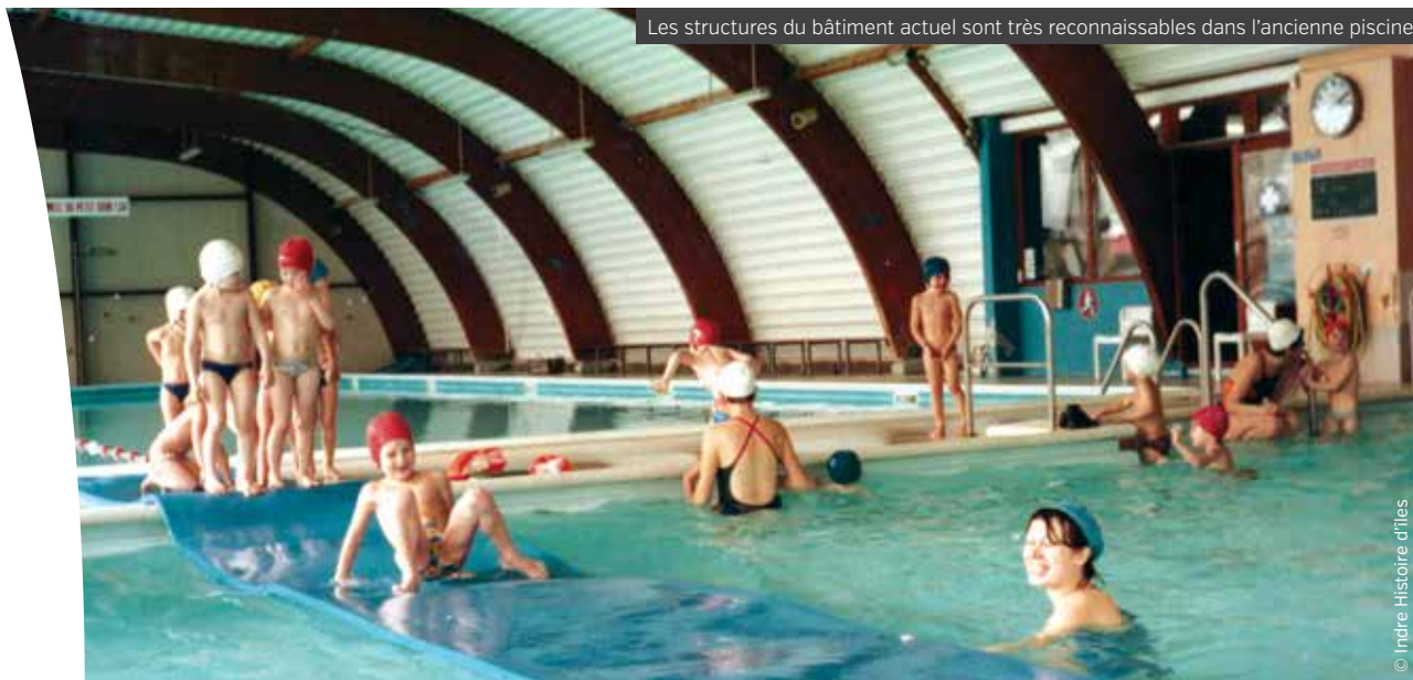
Les structures du bâtiment actuel sont très reconnaissables dans l'ancienne piscine

De 1975 à 1993, plusieurs générations d'Indrais ont fréquenté la piscine intercommunale, rue du Stade, apprenant à nager et à évoluer dans l'eau en toute sérénité. Transformée en Maison des Associations, elle regroupe alors les services de loisirs proposés par l'ACLEEA, la bibliothèque municipale ainsi que des salles mises à disposition d'associations.