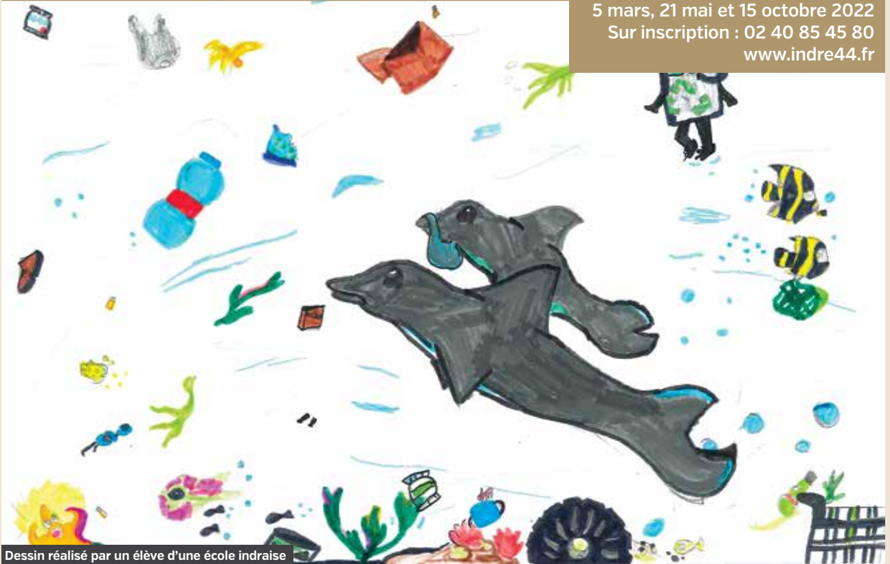
Dessin réalisé par un élève d'une école indraise

Prochains ramassages de déchets sur la commune : 5 mars, 21 mai et 15 octobre 2022 Sur inscription : 02 40 85 45 80 www.indre44.fr