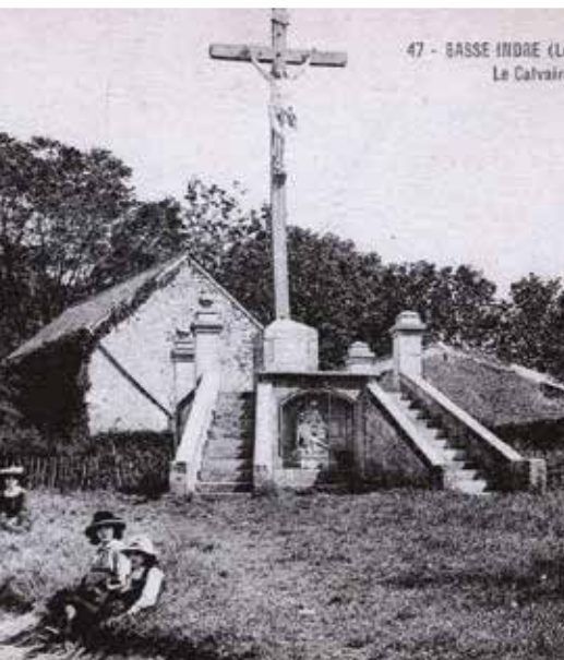
47 - BASSE-INDRE (Loire Inf.) Le Calvaire

Pour l'ensemble de ces travaux, Naolib proposera des adaptations de ses horaires et parcours.