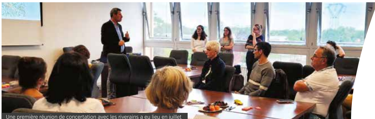
Une première réunion de concertation avec les riverains a eu lieu en juillet