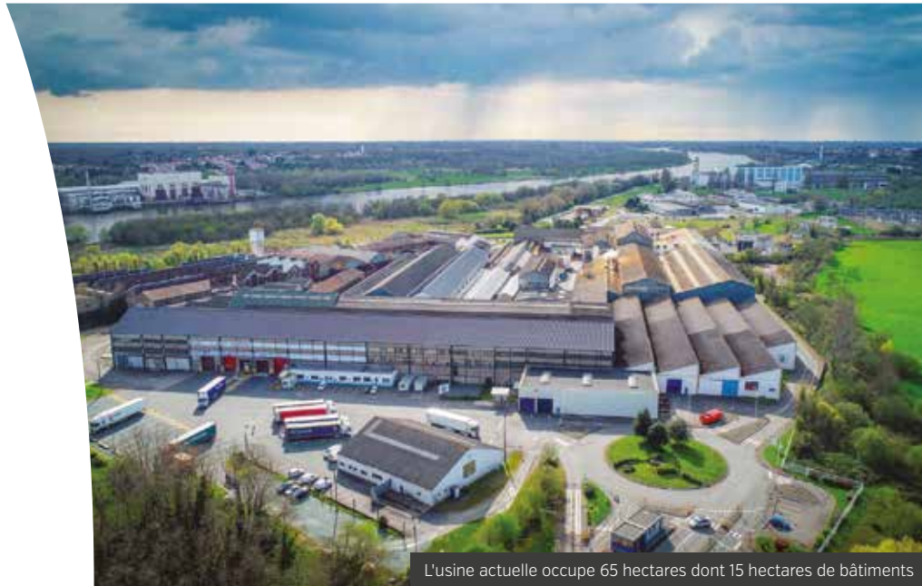
L'usine actuelle occupe 65 hectares dont 15 hectares de bâtiments

En 1824 les Forges de Basse-Indre s'installaient en bord de Loire. Depuis, l'innovation perpétuelle a permis au site de s'adapter et de perdurer dans le temps.